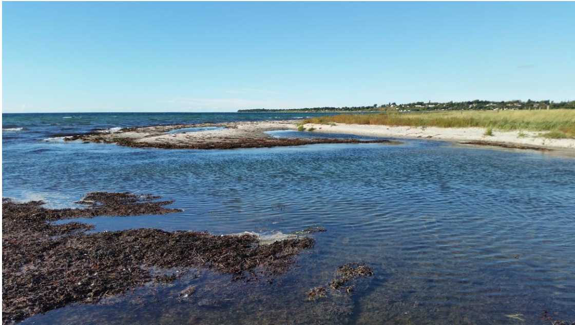
Tude Å's udmunding, markant anden udformning end situationen sidste år.