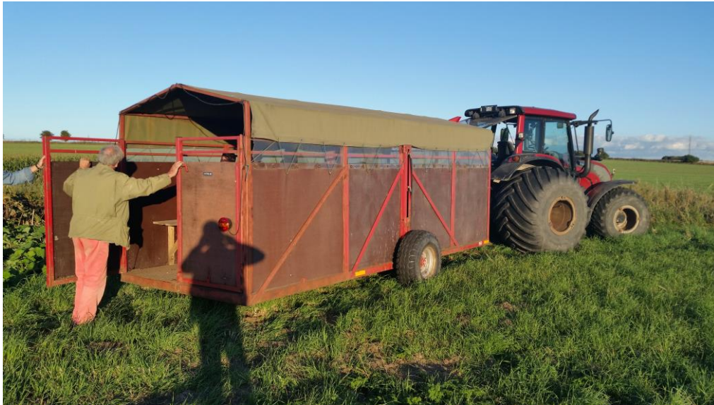
Besigtigelsestur i Valbygårdens jagtvogn.

Langs med Skidenrenden blev de af lystfiskerforeningen anlagte gydepladser besigtiget. Renden var vedligeholdt pænt, og der var god strøm i den besigtigede del af renden.