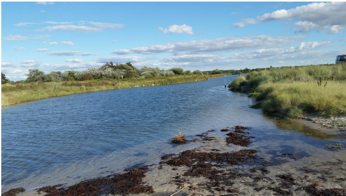
Åen's løb set mod Bildsøvej