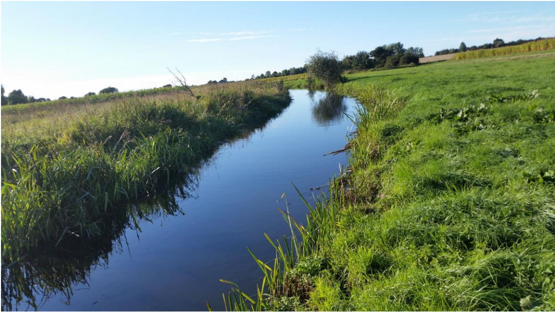
Tude Å nedstrøms ved Næsby Bro.