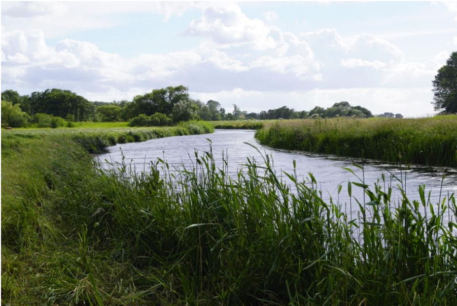
Å strækning ved Møllesøvej 10.