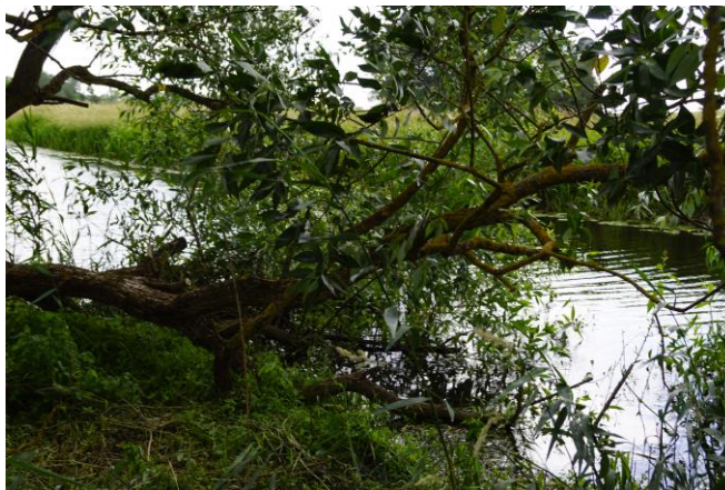
Bevoksning ved sammenløbet.