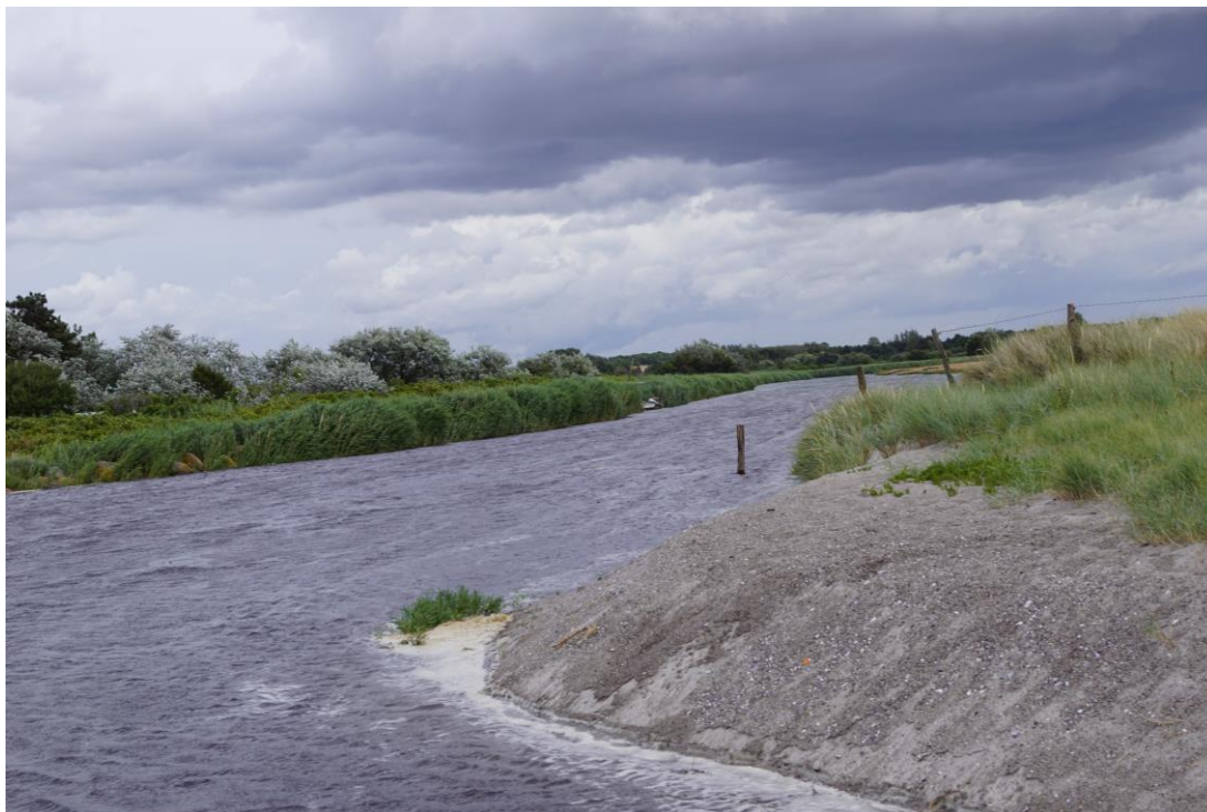
Ved udløbet ind mod land

Der kunne ikke oplyses noget om saltkoncentrationens i havvandets påvirkning af åkulturen.