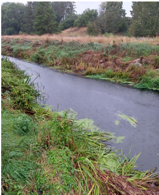
Tude Å, set mod vest