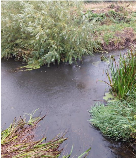
Jernbjerg Å's udløb

Igen så vi udragende pil udover Tude Å løbet. I øvrigt var der foretaget grødeskæring i år.