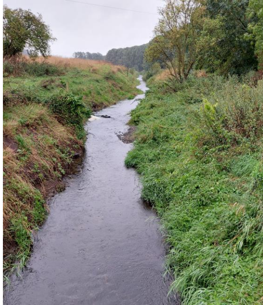
Jernbjerg Å ( mod syd)