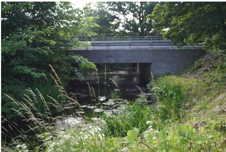
Broen under Kalundborgvej