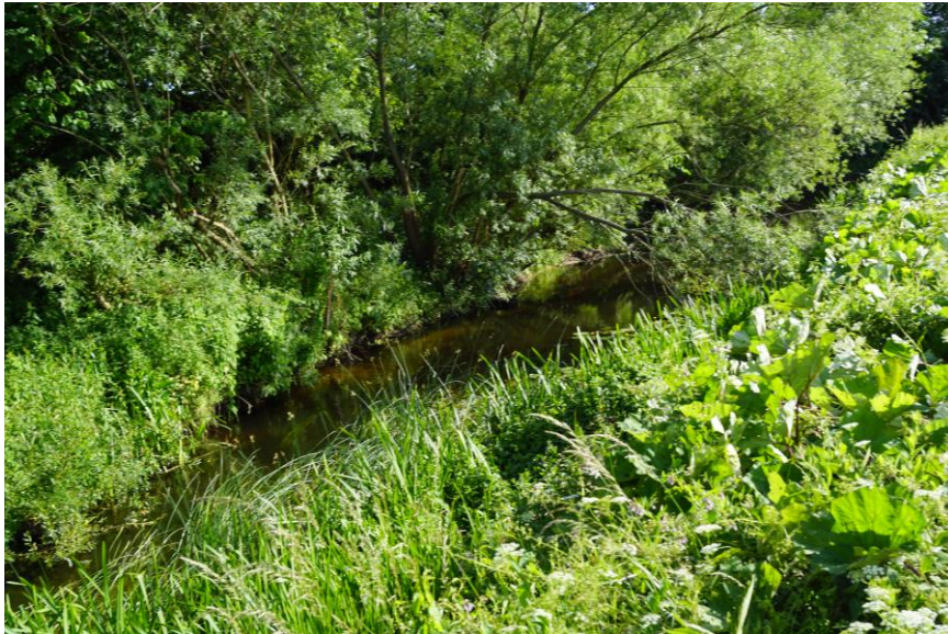
Bevoksning langs åen i Havrebjerg.