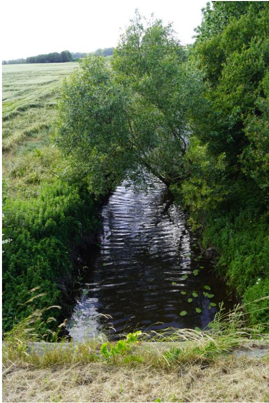
Vårby Å set fra landevejen