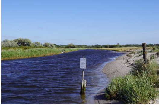
Udløbet set mod land